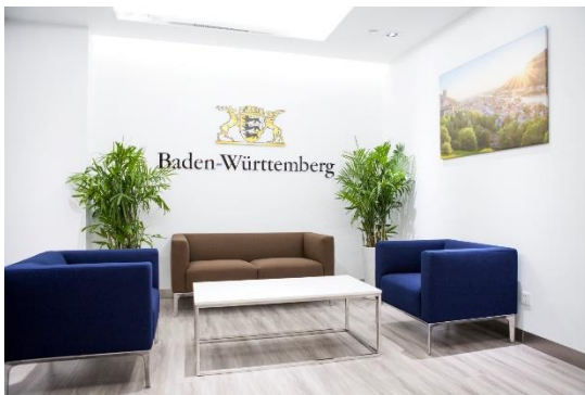
Eingangsbereich des Büros in Nanjing

Baden-Württemberg International Economic & Scientific Cooperation (Nanjing) Co., Ltd. (bw-i Nanjing) ist das Tochterunternehmen von Baden-Württemberg International, der Wirtschafts- und Wissenschaftsförderungsgesellschaft des Landes Baden-Württemberg. Mit mehr als 30 Jahren Erfahrung im chinesischen Markt unterstützt bw-i Nanjing deutsche Unternehmen kompetent beim Markteintritt in China. Der Zugang zum chinesischen Markt kann insbesondere durch sprachliche, kulturelle und bürokratische Hürden erschwert werden. Bw-i Nanjing steht Ihnen mithilfe der langjährigen Erfahrung in China, Fachwissen sowie des weit verbreiteten Netzwerks zur Seite und leistet die notwendige Hilfestellung.