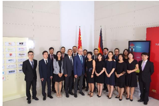
Team im Büro Nanjing

Das Dienstleistungsangebot umfasst folgende Bereiche: